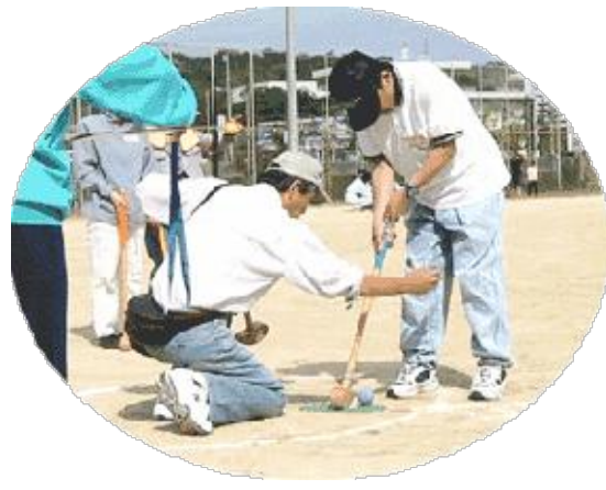
ねらいをさだめて…