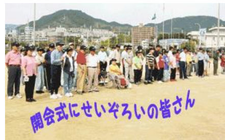
開会式にせいぞろいの皆さん