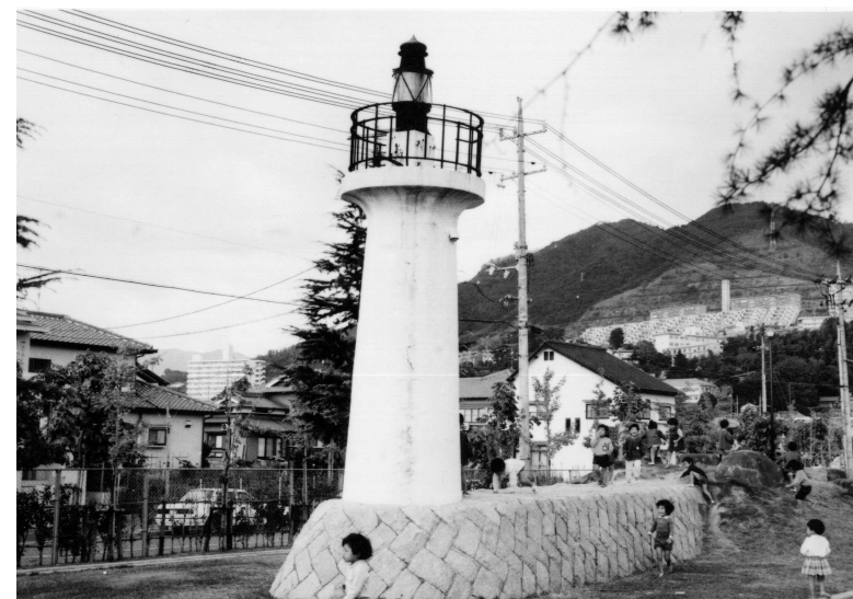
(広報ひろしま「市民と市政」昭和61年11月1日号より)

また、草津の沖合は魚介類の好漁場でなかでもカキは美味で知られていた。大消費地である広島城下の発展につれてその台所を預かる草津には、多くの魚介類が水揚げされるようになり、明和年間(1764～1771年)には本格的な魚市も開かれ始めた。